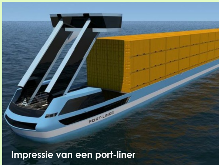
Impressie van een port-liner

Toch zou het goed zijn zuinig te zijn op onze eigen taal: het Nederlands. Wanneer er buitenlandse gasten zijn moet er gezorgd worden voor een simultane vertaling. Natuurlijk brengt dit een kostenplaatje met zich mee, maar als Nijmegen zo'n groot congres organiseert moet dit het breekpunt niet zijn.