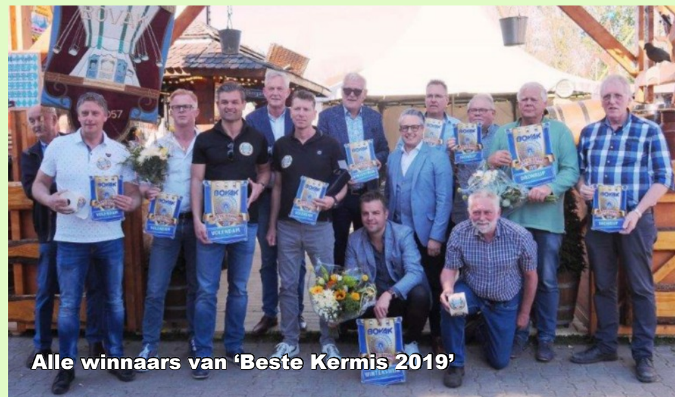
Alle winnaars van 'Beste Kermis 2019'