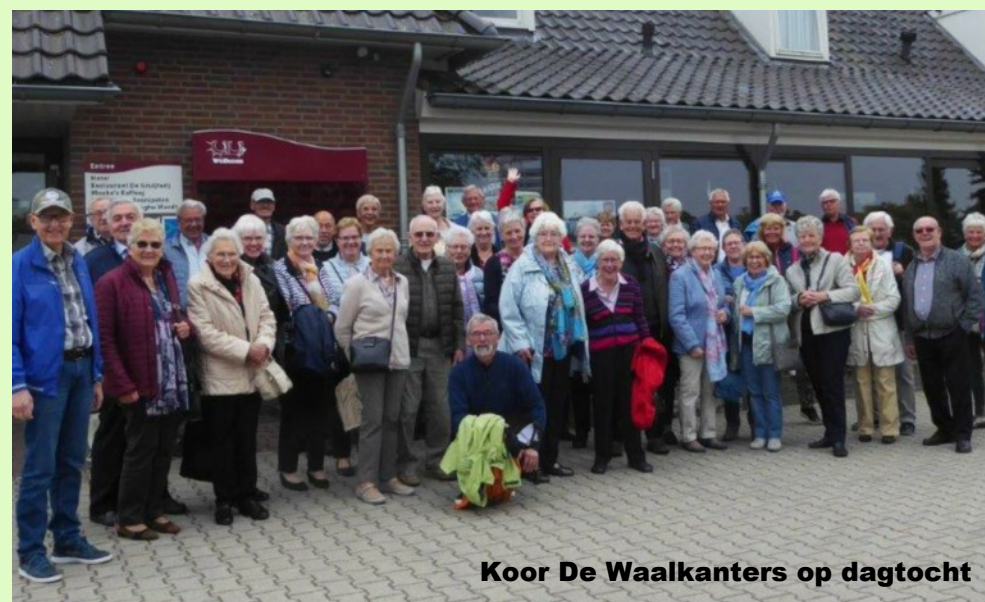
Koor De Waalkanters op dagtocht

Ik wens iedereen hele mooie en gezegende Kersttijd en een mooie jaarwisseling vol goede plannen voor het nieuwe jaar.