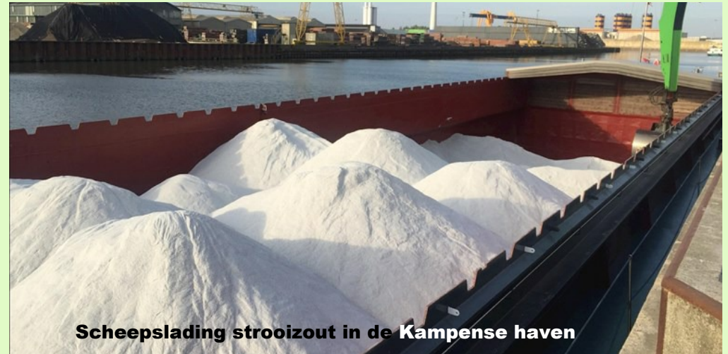
Scheepslading strooizout in de Kampense haven

Niet in het chique pak, maar in de blauwe overall. Het was weer een veilige kerst.