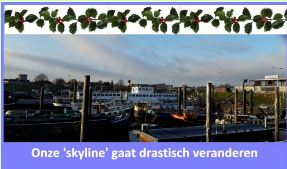
Onze 'skyline' gaat drastisch veranderen

Als ik het stukje van NNP voor het bulletin van vorig jaar december weer eens teruglees, heeft het aan actualiteit nog niets ingeboet. Alweer een snikhete, droge zomer achter de rug. Lage waterstanden. Afbreek-geruis op het Hilckmanterrein. En nog steeds zorgen over de geplande bebouwing rondom het havengebied.