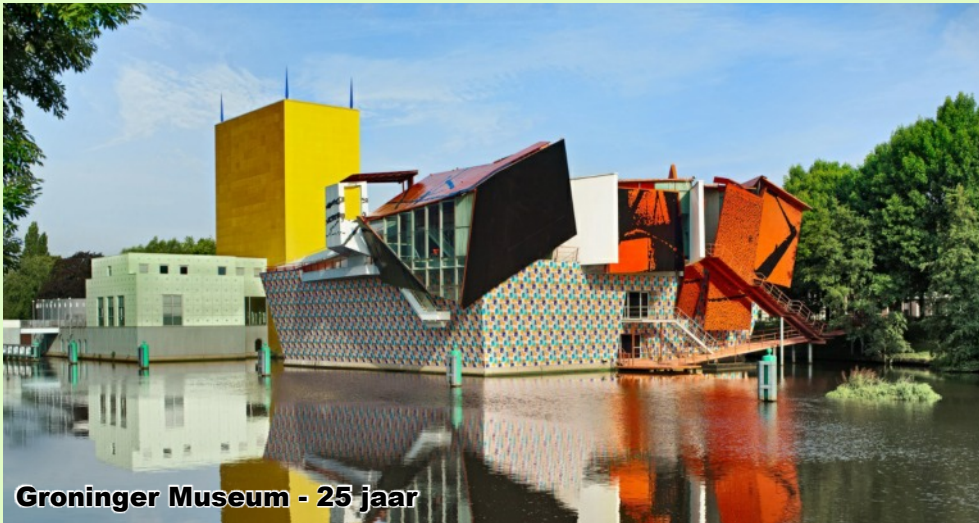
Groninger Museum - 25 jaar

directeur van het museum zijn poot stijf heeft gehouden. Wat een snoepje is het gebouw. Omdat het een kwart eeuw geleden is geopend, hebben ze Allesandro gevraagd een tentoonstelling in te richten. Over zijn werk en ook met werk van andere (van die heerlijk maffe) kunstenaars en scheppers. Een feest in kleur en vorm die het spreekwoordelijke 'grauwe' van het noorden de Waddenzee in veegt.