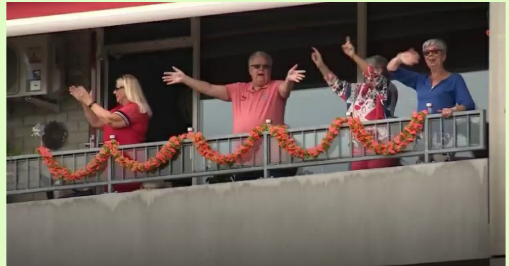
Wandelaars werden vanaf een balkon aan de Annastraat in Nijmegen enthousiast binnengehaald

bank is dan geen vast onderdeel van ons dagelijks leven meer, de Posbank (ten noordoosten van Arnhem) zal binnen enkele dagen paars kleuren als de heide voor de nazomer opfleurt. Tientallen kilometers uiterwaarden zijn natuur- en wandel- of fietsgebieden geworden, zoals bij Wageningen en Rhenen, maar ook langs de Waal, de Maas, de Linge en de Geldersche IJssel. En ook in de Randstad zijn prachtige combinaties te verzinnen.