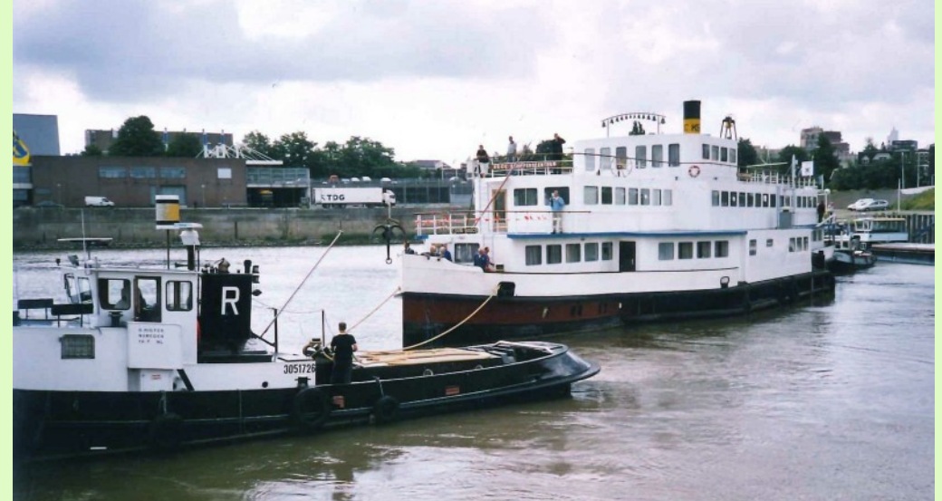
KSCC Schipperscentrum wordt naar de werf gesleept in 2004