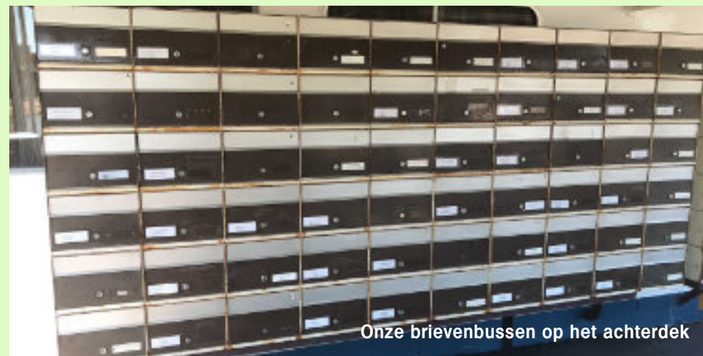
Onze brievenbussen op het achterdek

De meeste houders die bij ons een brievenbus huren hebben als officieel woonadres Postbus 390. Nu de postbus wordt opgeheven betekent het dat zij zullen moeten gaan 'verhuizen' naar Waalhaven 1k.