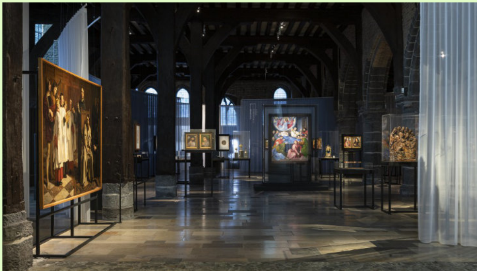
Tentoonstelling in het Sint-Janshospitaal

Ilya Pfeijffer ziet in het schilderij het belang van het geloof in de wederopstanding. Het is een treurig beeld, zegt hij: iemand gaat dood maar tegelijkertijd ligt de nadruk op de wederopstanding, op het geloof in de wederopstanding en dat versterkt de hoop. Volgens Ilya Pfeijffer is Maria de machtigste vrouw, die al eeuwen vereerd wordt. Maria is de ster in het werk van Van der Goes, de universele vrouwenfiguur die symbool staat voor troost. Zij de bemiddelaarster tussen de aarde en de hemel. "Haar taak is om voor ons stervelingen voorspraak te doen in de hemel."