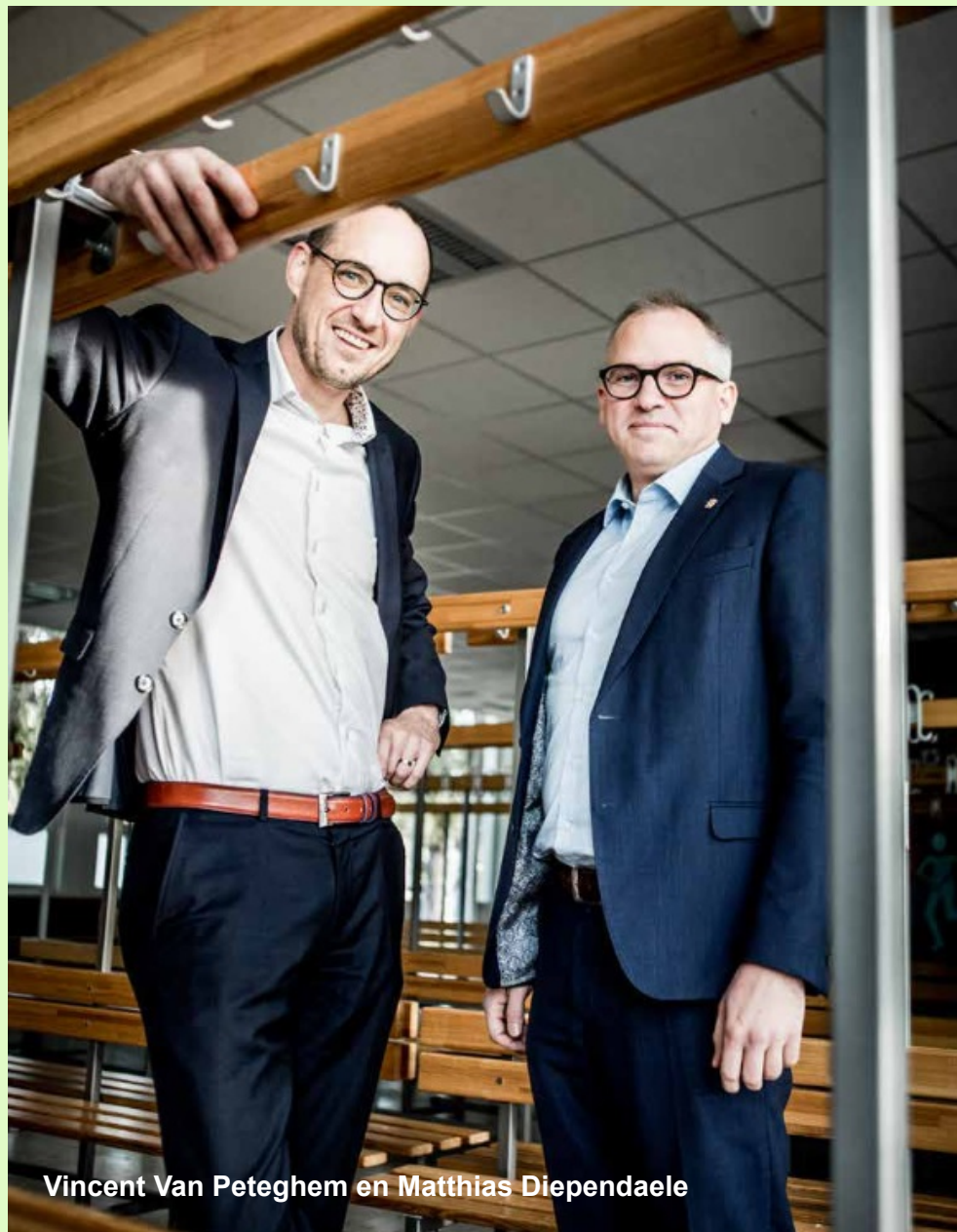
Vincent Van Peteghem en Matthias Diependaele

Vincent: “Dat had ik bij de sporthal! Ik weet nog goed hoe onze frisbee daar eens op het dak belandde en we dan maar beslisten om op het dak verder te spelen. Tijden!”