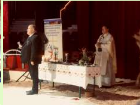
Kerstviering 25 december 2022, circus Freiwald