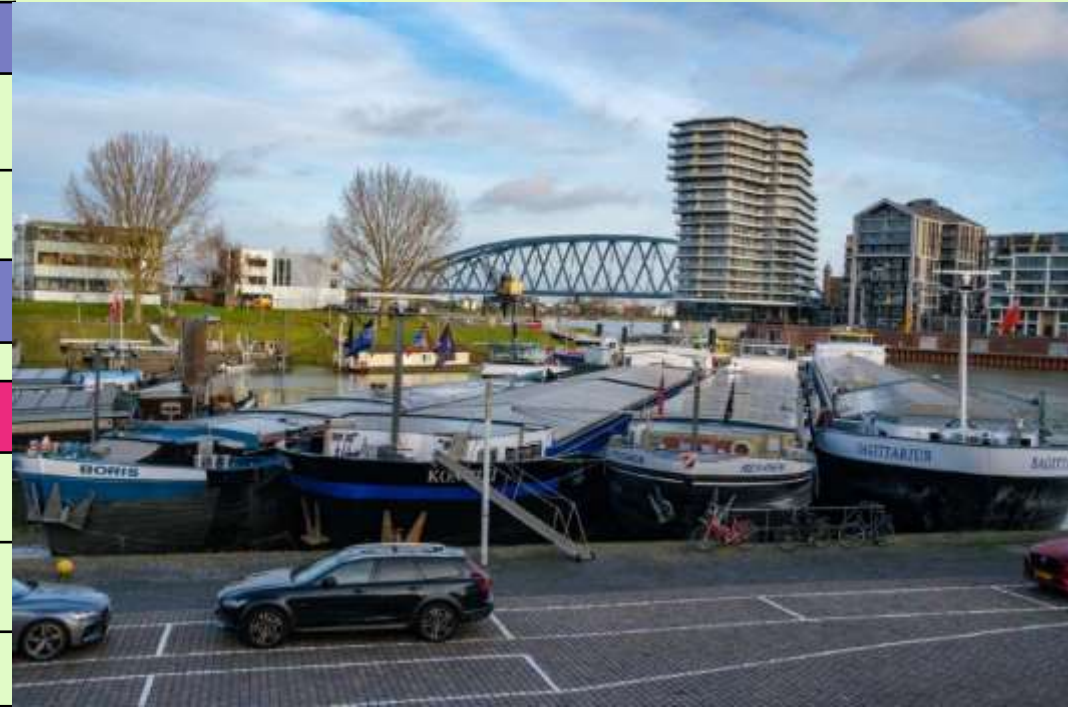
27 december 2022, Armada Waalhaven, foto's William Peters

Contactpersoon voor SV St. Nicolaas: Peter Bex E-mail: msvstnicolaas2gmail.com