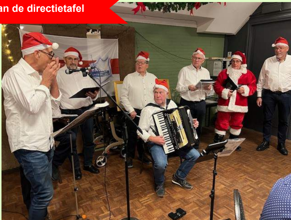
Een deel van het zeemanskoor Schip Ahoy uit Angeren spelen tijdens de kerstviering in Doornenburg.