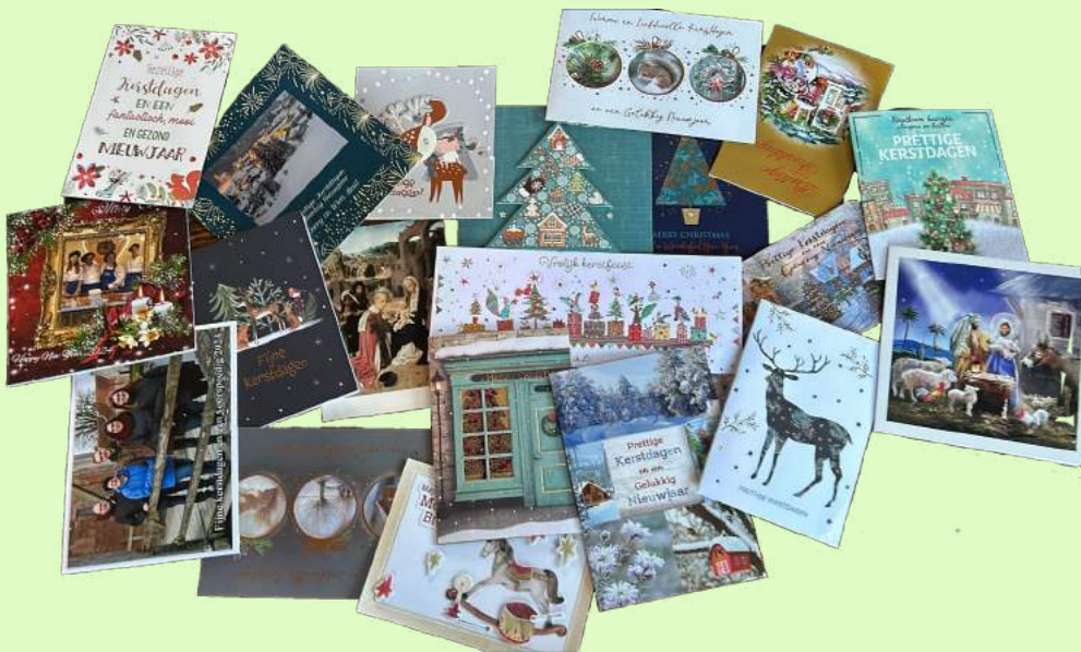
Een deel van alle mooie kaarten en wensen.

Het eerste nummer van het Christoffelnieuws 2024 ligt voor u. Zegen over 2024 in verbondenheid met een respect voor elkaar is de wens van de crew van het KSCC en parochie. Dank voor de vele kerst- en nieuwjaarswensen die per post, per mail en WhatsApp et cetera ontvangen zijn. Vaak hele mooie kaarten en wensen met inspirerende teksten.