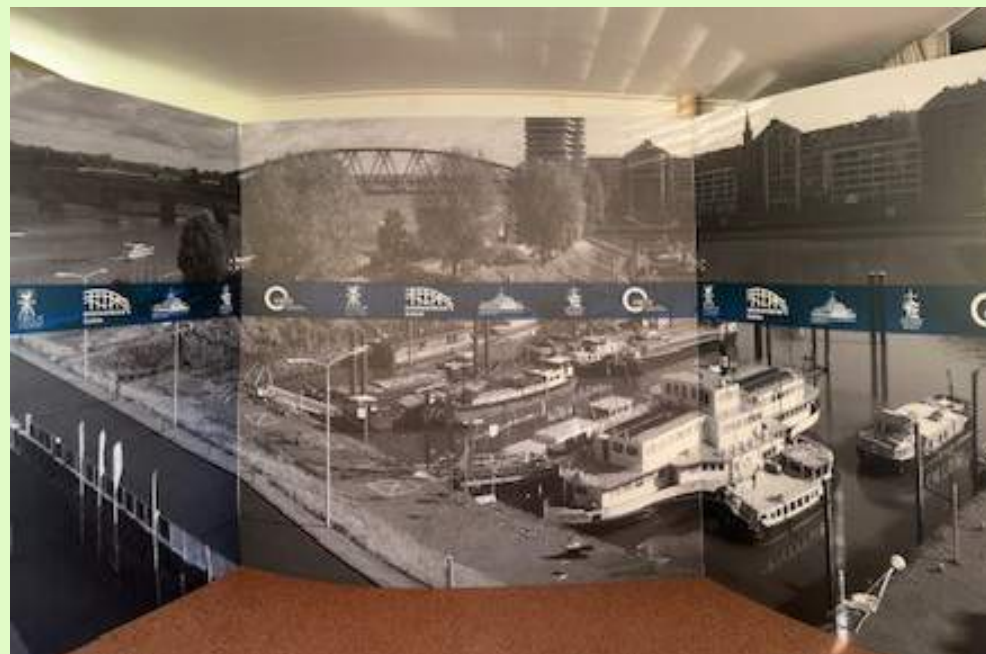
Nieuwe achterwand videopodcast aalmoezenier