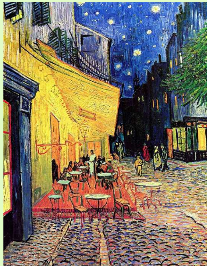
Terrasse du café le soir, 1888. Vincent van Gogh (1853-1890)

De beau monde van de grote steden ontdekt in de 19e eeuw de charme van het buiten bij elkaar zitten aan de grote openlucht-sociëteiten als Montparnasse en de Boulevard des Italiens in Parijs. Ook de Nederlandse gegoede burgerij verzamelt zich in de stoelen voor het Grand Hôtel des Bains en het Kurhaus in Scheveningen. Maar alleen zij. De rest van Nederland strompelt voorbij en vergaapt zich aan de rijkdom.