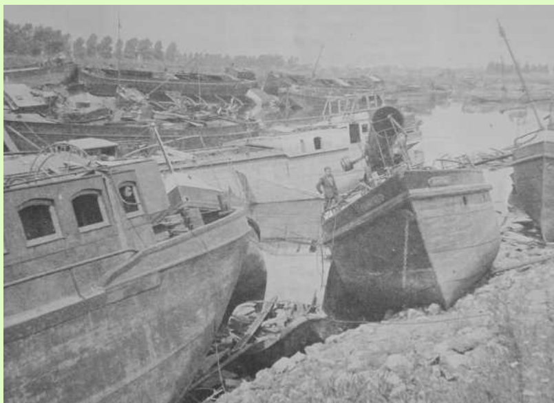
Schepenkerkhof haven Maasbracht 1944