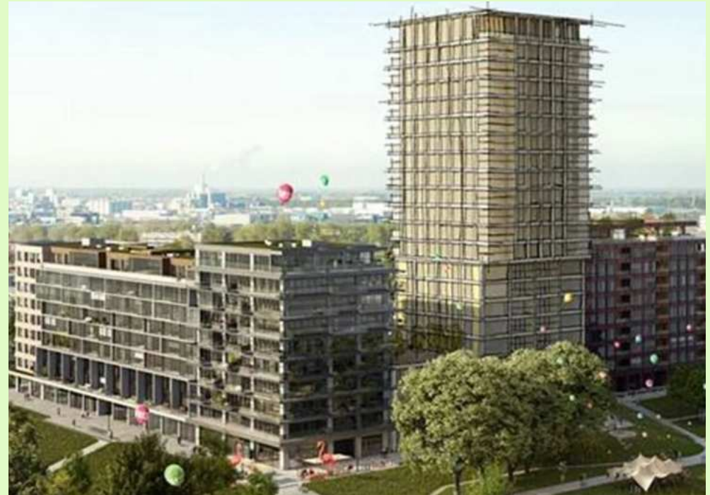
Impressie van de Iris nieuwbouw