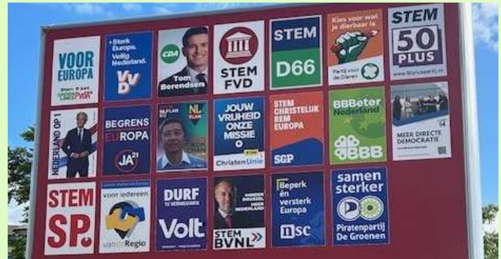
EU Verkiezingsbord 2024

Niet stemmen betekent ook geen kritiek hebben op de overheid. Juist door te stemmen ben je medeverantwoordelijk voor het reilen en zeilen in Nederland. Het onderwerp volksraadplegingen (referenda) komt boven. Eigenlijk is dit vreemd. De door ons gekozen volksvertegenwoordigers zouden in staat moeten zijn de goede richting te kiezen en in gezamenlijkheid de goede besluit nemen. Juist door contact met de burgers zouden zij moeten weten wat er leeft en speelt. Maar alle goede voornemens ten spijt ontbreekt dit. De laatste landelijke en provinciale verkiezingen hebben dit duidelijk bloot gelegd. Het lijkt of men daar nog niet voldoende van geleerd heeft.