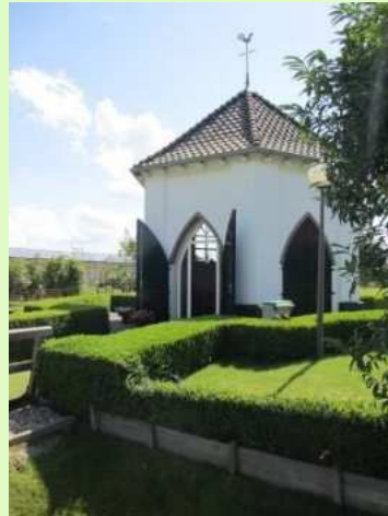
Mariakapel in Hulhuizen

Op zondag 14 juli vieren wij weer onze traditionele Openlucht Schippersmis. Dit jaar zijn we uitgeweken naar het gazon bij de Mariakapel in Hulhuizen. Deze prachtige kapel bestaat dit jaar 25. Mocht het weer ons daartoe nopen, dan wijken we uit naar het Ontmoetingscentrum in Doornenburg.