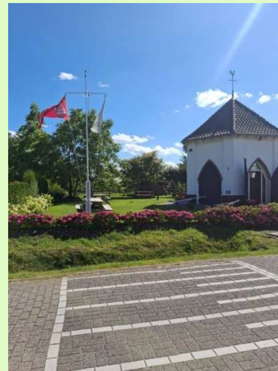
Mariakapel in Hulhuizen