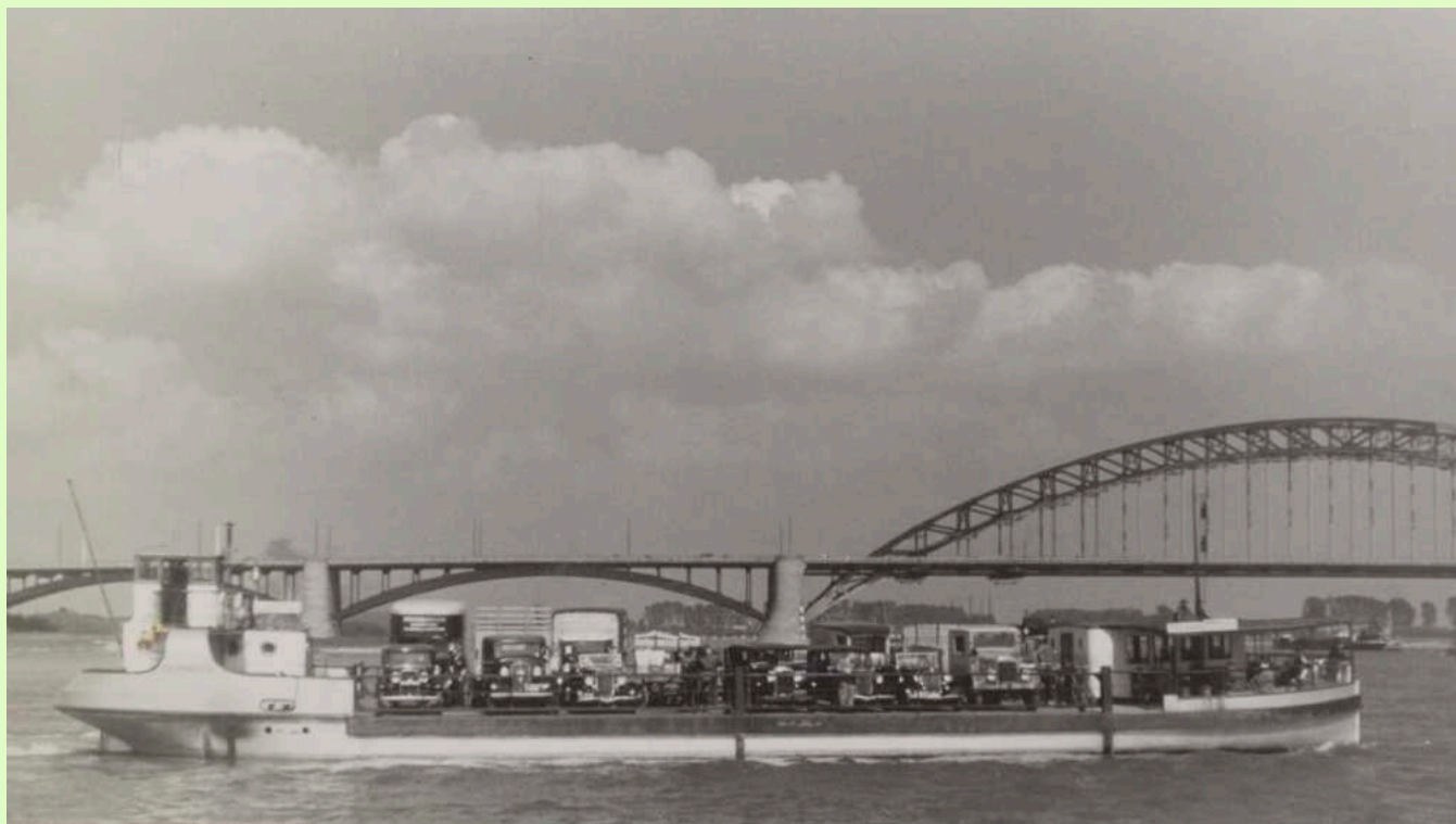
1936 - Veerpont over de Waal bij Nijmegen, op de achtergrond de nieuwe Waalbrug.

En gierpont Zeldenrust? Die gaat in 1936 met pensioen als op 16 juni van dat jaar koningin Wilhelmina het rode lint van de Waalbrug doorknipt. Applaus van 200.000 toeschouwers weerklinkt voor een brug van 900.000 klinknagels. Nijmegen is een open provinciestad geworden