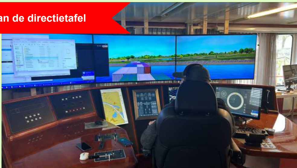
De simulator wordt geïnstalleerd