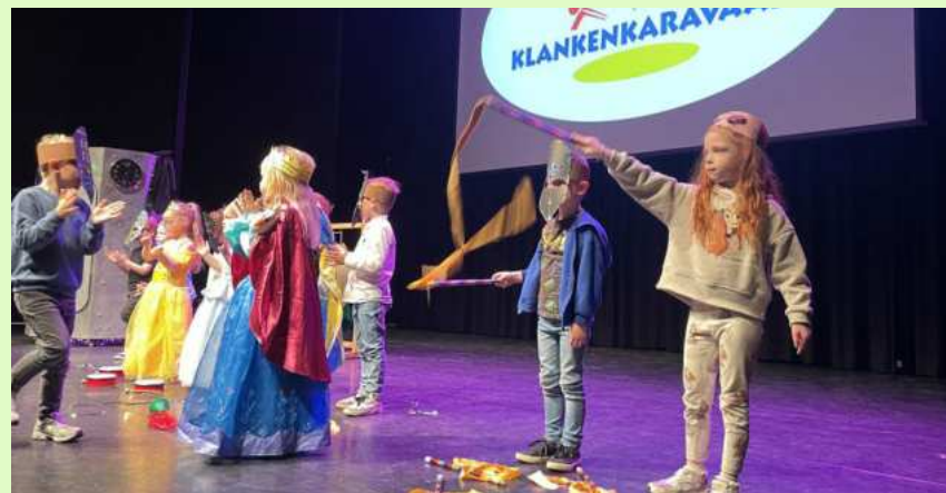
Ridders en prinsen